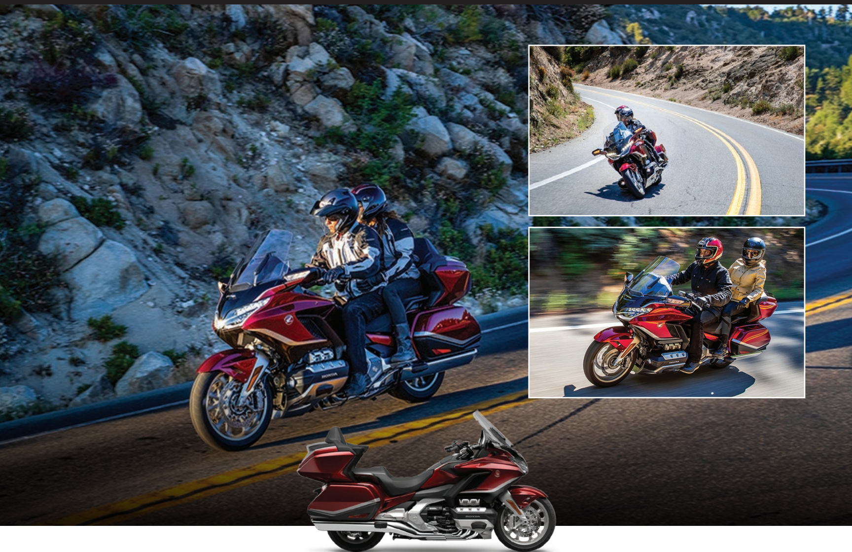
GOLDWING TOUR DCT AIRBAG 2021