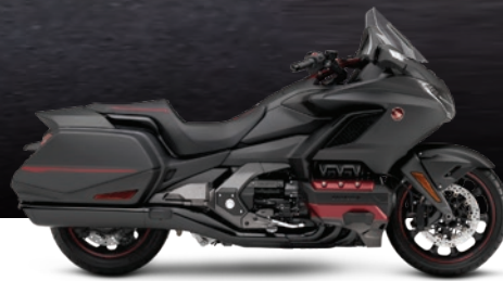
GOLDWING DCT 2021