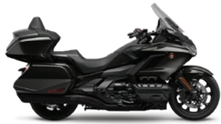
GOLDWING TOUR DCT

Rouge candy ardent/Noir profond métallisé (bicolore)