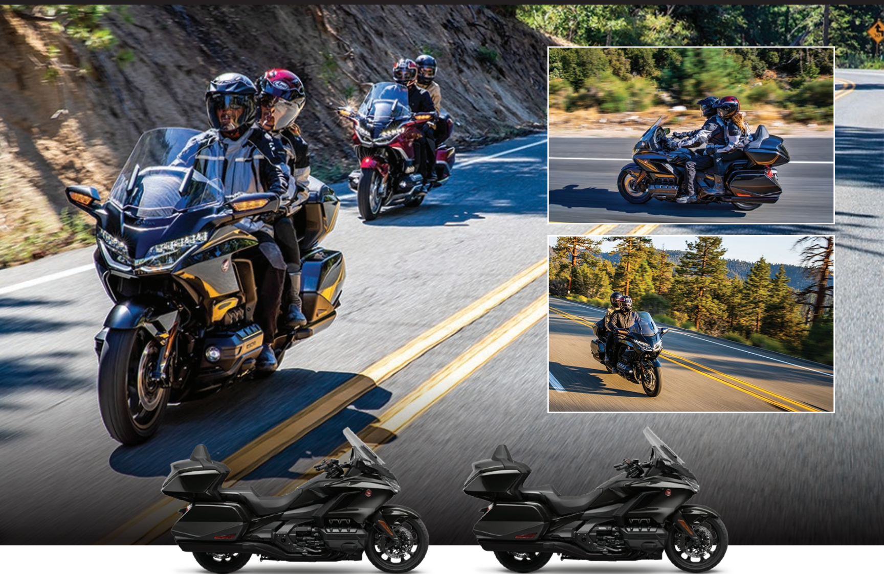
GOLDWING TOUR 2021