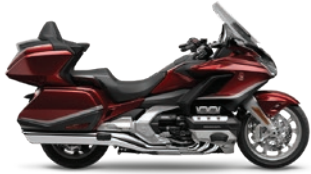
GOLDWING TOUR DCT AIRBAG