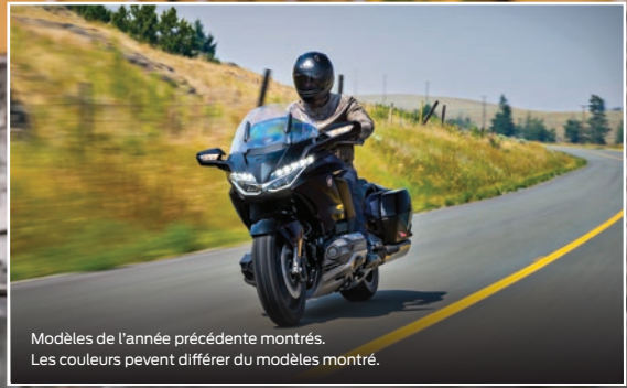
Modèles de l'année précédente montrés. Les couleurs peuvent différer du modèles montré.