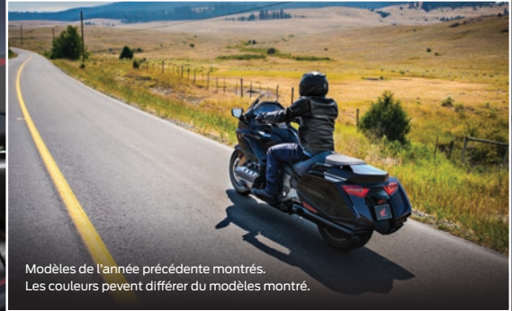
Modèles de l'année précédente montrés. Les couleurs peuvent différer du modèles montré.